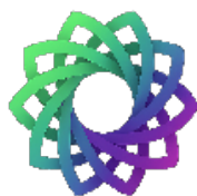
VERSATILE USE WSZECHSTRONNE UŻYCIE